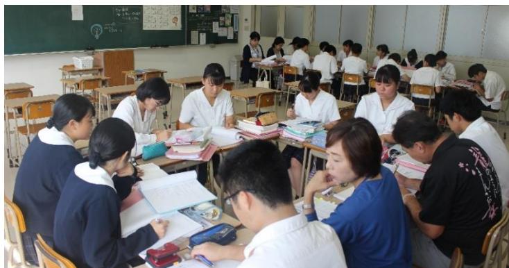
学校での反省会の様子

介護実習(医療福祉科 2 年生)は 4 週間、成人看護臨地実習(看護学科 3 年生)は 3 週間、それぞれ 10 月 11 日(金)まで校外での実習が終了しました。日々自らの学びがあり、貴重な出会いがあり、現場の職員さんに丁寧な指導をいただきました。実習後のひとりひとりの成長に期待しています。また看護学科専門課程 2 年生は 5 月から始まった長期に渡る臨地実習が 11 月初旬まで続きます。“看護師になる”夢実現へ。チェスト! キバレ!!